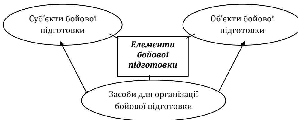
Рис. 1. Складові елементи бойової підготовки