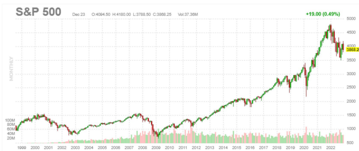
Рис. 1. Динаміка фондового індексу S&P500 в період з 2000 року [29]

Однією із найбільш значних криз останніх десятиліть була криза 2008-2009 років, яка вплинула на всі країни та суттєво уповільнила їх економічний розвиток. Одним із відображень стану світової економіки сьогодні є фондовий ринок, при цьому найбільшою фондовою біржою є Нью-Йоркська, де здійснюють торгівлю цінними паперами найбільш потужних компаній світу. Одним із індикаторів розвитку фондового ринку в свою чергу виступають фондові індекси, які на думку авторів, можна вважати відображенням тенденцій розвитку економічних процесів загалом та наявності балансу в ринковому середовищі. Одним з найбільш інформативних та універсальних індексів є S&P500, який відображає ринкове позиціонування п'ятисот найбільших та найвпливовіших компаній США. Його динаміка в період з 2000 року наведена на рис. 1.