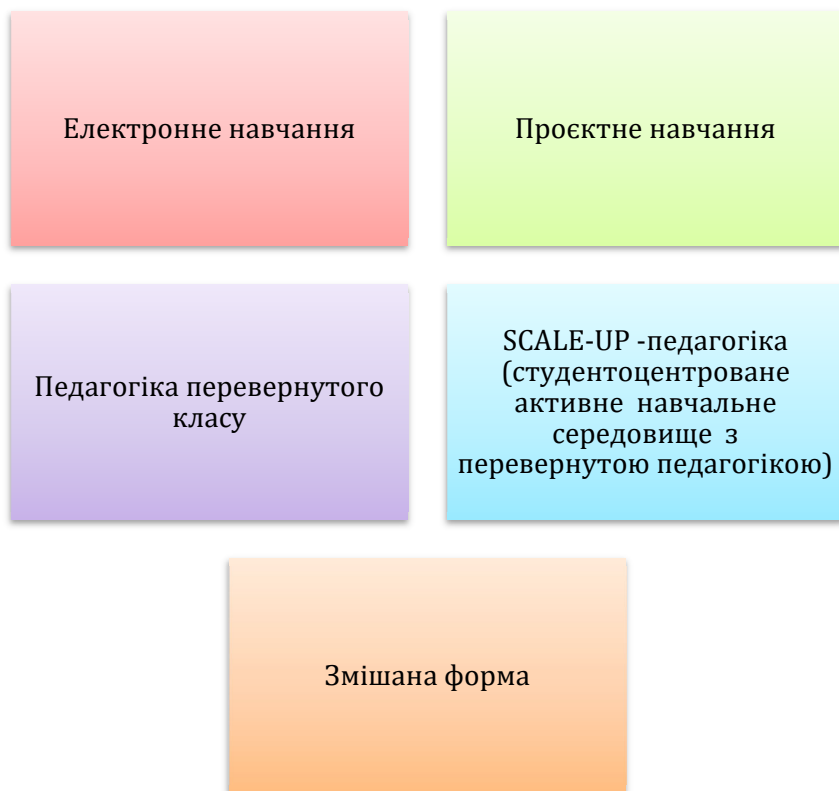
Рис. 1. Інноваційні методи навчання