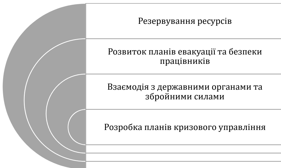
Рис.2. Стратегічне планування для забезпечення економічної безпеки

Підприємства будівельної галузі повинні враховувати можливість обмеження доступу до ресурсів під час воєнного стану. Створення резервів будівельних матеріалів, обладнання та інших необхідних ресурсів дозволить підприємствам уникнути перерв у виробництві та забезпечити продовження будівельних проектів.