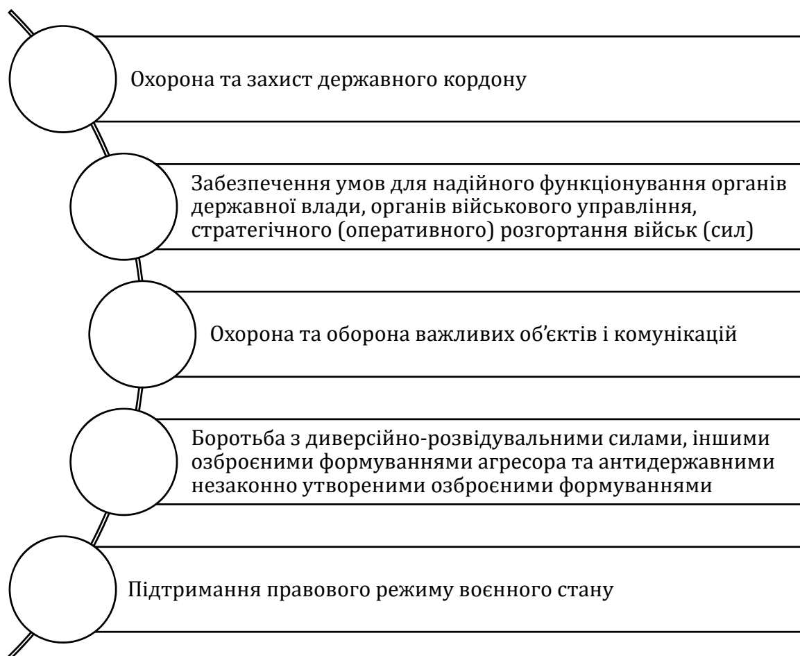
Рис. 2. Завдання Сил територіальної оборони ЗСУ на початок війни в Україні

На початку війни було визначено завдання для Сил ТрО ЗСУ, які представлено на рисунку 2.