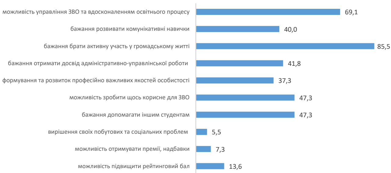
Рис. 1. Розподіл відповідей лідерів студентських організацій ЗВО на запитання: «Які цілі спонукають здобувачів вищої освіти долучатись до студентського самоврядування Вашого ЗВО?», % від кількості опитаних

На запитання «Які цілі спонукають здобувачів вищої освіти долучатись до студентського самоврядування Вашого ЗВО?» респонденти віддали перевагу таким напрямкам: бажання брати активну участь у громадському житті (85,5% опитаних), можливість управління ЗВО та вдосконаленням освітнього процесу (69,1%), можливість зробити щось корисне для ЗВО (47,3%), бажання допомагати іншим студентам (47,3%) (рис. 1).