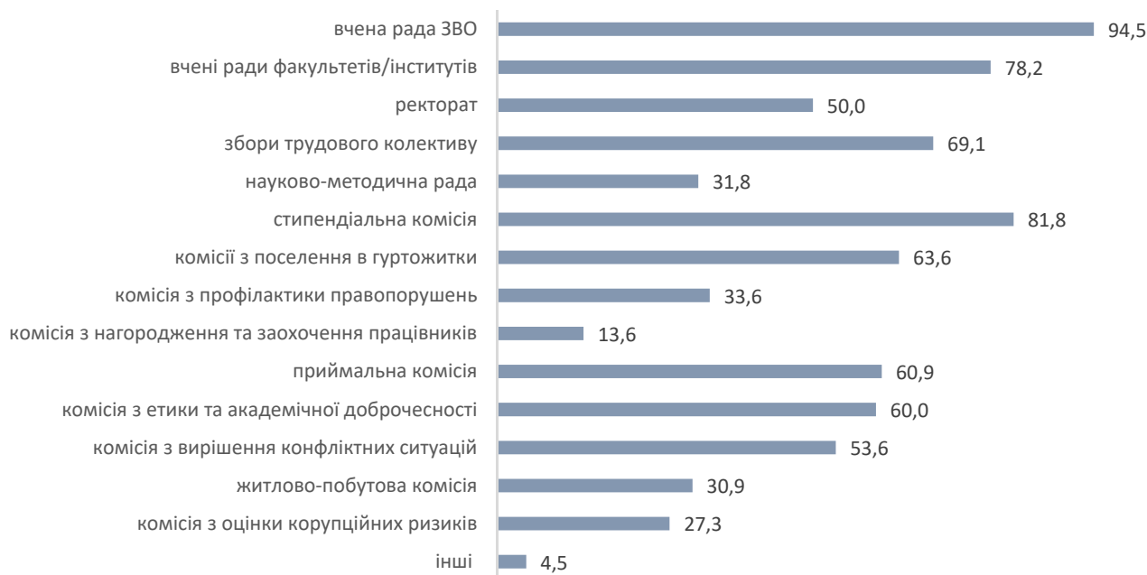
Рис. 4. Розподіл відповідей лідерів студентських організацій ЗВО на запитання: «У яких робочих, консультативно-дорадчих радах та комісіях Вашого ЗВО є представники органів студентського самоврядування?», % від кількості опитаних

На рис. 4 наведена демонстрація відсоткових показників залученості представників ОСС до робочих, консультативно-дорадчих рад та комісій ЗВО.