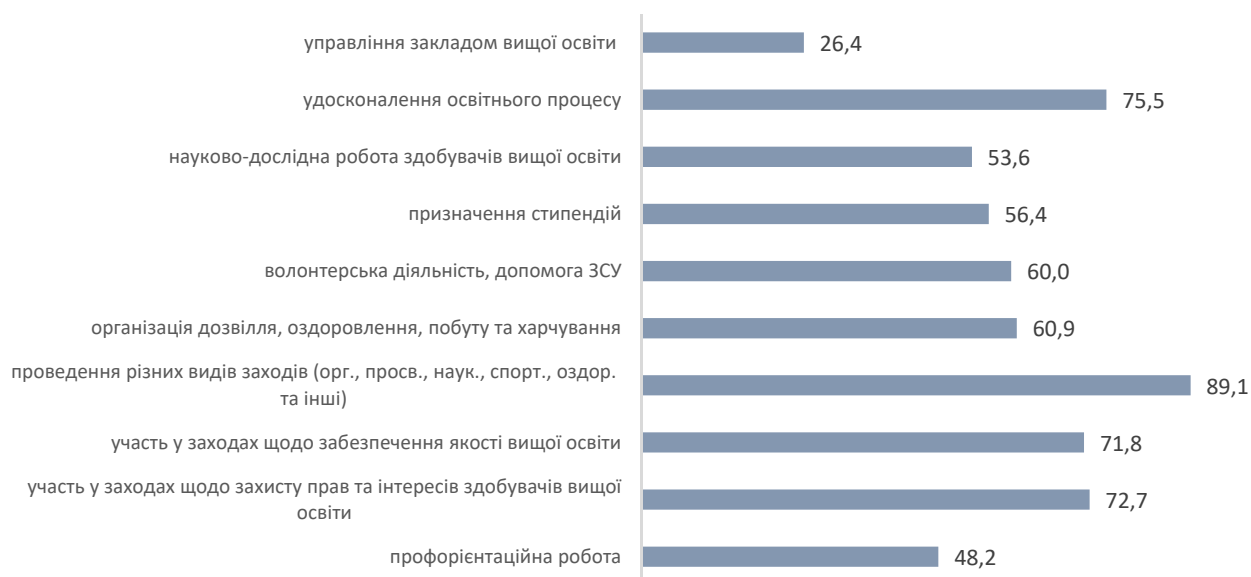
Рис. 6. Розподіл відповідей лідерів студентських організацій ЗВО на запитання: «Які питання найбільш вдало вирішуються органами студентського самоврядування Вашого ЗВО?», % від кількості опитаних

Низькою є оцінка опитаних лідерів студентських організацій ЗВО щодо вдалого вирішення ОСС такого питання як управління закладом вищої освіти (рис. 6).