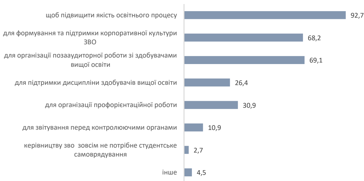
Рис. 2. Розподіл відповідей лідерів студентських організацій ЗВО на запитання: «Навіщо, на Вашу думку, адміністрації ЗВО потрібне студентське самоврядування?», % від кількості опитаних

Майже всі опитані вважали, що адміністрації ЗВО студентське самоврядування необхідне для підвищення якості освітнього процесу, дві третини опитаних – що воно потрібне для формування та підтримки корпоративної культури ЗВО та організації позааудиторної роботи зі здобувачами вищої освіти. Одна третина опитаних вважала, що адміністрація ЗВО використовує студентське самоврядування для організації профорієнтаційної роботи та підтримки дисципліни здобувачів вищої освіти. Майже 11% опитаних вважали, що адміністрації ЗВО студентське самоврядування необхідне для звітування перед контролюючими органами (рис. 2).