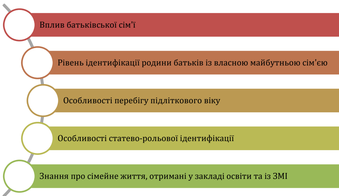
Рис. 1. Головні чинники, які впливають на формування уявлень про сім'ю у підлітків з інтелектуальними порушеннями