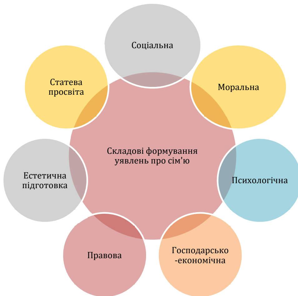
Рис. 2. Складові процесу формування уявлень про сім'ю у підлітків з інтелектуальними порушеннями