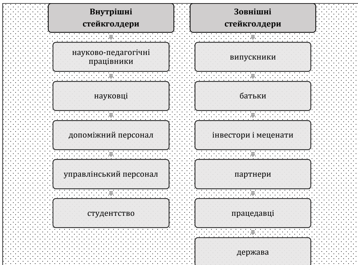
Рис. 2. Внутрішні і зовнішні стейкхолдери

Науковець В. Корнещук, виокремлює можливі форми співпраці зі стейкхолдерами у сфері вищої освіти. Тут йдеться про «залучення стейкхолдерів до розробки та перегляду освітніх програм; запрошення стейкхолдерів на навчально-методичні семінари на базі кафедри; анкетування дійсних стейкхолдерів; анкетування потенційних стейкхолдерів; встановлення договірних відносин, що передбачають зокрема можливість проведення виробничої та переддипломної практики студентів на базі установ стейкхолдерів, подальше працевлаштування випускників кафедри тощо; залучення провідних фахівців установ стейкхолдерів до проведення навчальних занять на базі ЗВО та на базі установи стейкхолдера; залучення провідних фахівців установ стейкхолдерів, а також випускників кафедри до проведення занять і майстер-класів в межах студентських наукових гуртків; запрошення представників установ стейкхолдерів на захист кваліфікаційних робіт здобувачів вищої освіти першого (бакалаврського) та другого (магістерського) рівнів; залучення академічної спільноти до розробки навчально-методичного забезпечення дисциплін, передбачених ОП; проведення разом з академічною спільнотою педагогічних експериментів, спрямованих на підвищення якості вищої освіти» [5, 127]. Як бачимо із наведеної цитати, в основному розглядається можливість активної участі зовнішніх стейкхолдерів у співпраці із закладом вищої освіти.