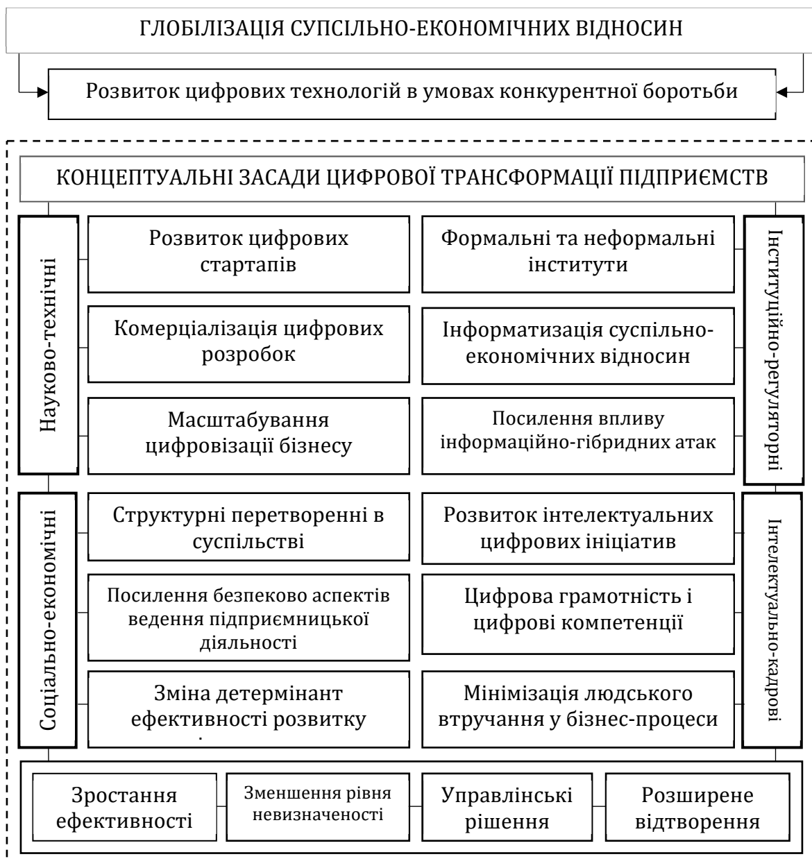
Рис. 2. Концептуальні засади цифрової трансформації підприємств

нових клієнтів (споживачів, покупців), у тому числі з використанням ресурсних потужностей Інтернет-маркетингу та соціальних мереж; (2) оптимізація операційних процесів на всіх етапах формування доданої вартості бізнесу; (3) створення інноваційних продуктів і послуг на засадах використання потужностей цифрових технологій бізнесу. Таким чином, концептуальні засади цифрової трансформації підприємств виходять далеко за межі виключно господарського процесу та охоплюють цифрові структурні перетворення, що мають місце в процесі суспільно-економічного обміну (рис. 2).