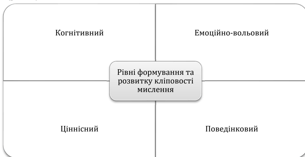
Рис. 1. Рівні формування та розвитку кліповості мислення

Феномен кліповості мислення варто розглядати в широкому контексті, адже психологи стверджують, що кліповість мислення формується та розвивається на різних рівнях (рис. 1).