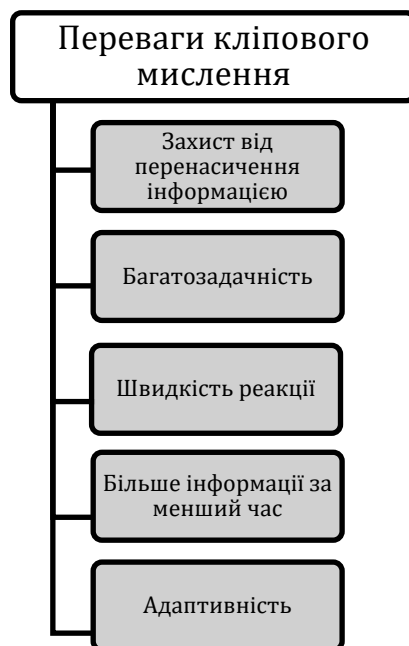
Рис. 2. Переваги кліпового мислення

Кліпове мислення також розвиває в людини багатозадачність і швидкість реакції. Великі обсяги інформації та їх швидка зміна сприяють покращенню здатності перелаштовуватися і бути адаптивними, що вкрай важливо в умовах динамічного розвитку суспільства. Людина може діставати більшу кількість інформації за значно менший проміжок часу.