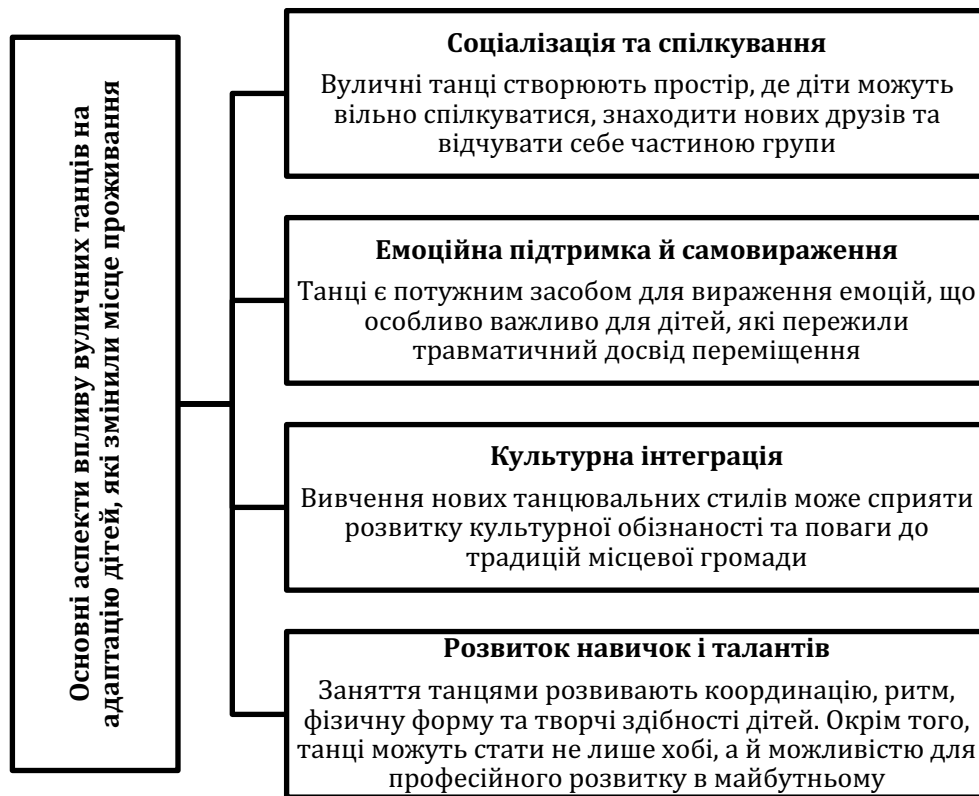
Рис. 2. Основні аспекти впливу вуличних танців на адаптацію внутрішньо переміщених дітей

Вуличні танці як частина урбаністичної культури здатні сприяти розвитку соціальних зв'язків, формуванню почуття спільноти та допомагати дітям подолати емоційні й психологічні труднощі, викликаними зміною місця проживання (рис. 2).