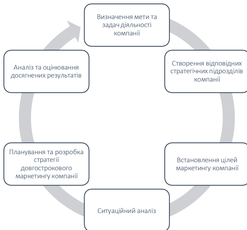
Рис. 1. Схема процесу довгострокового стратегічного планування діяльності компанії*