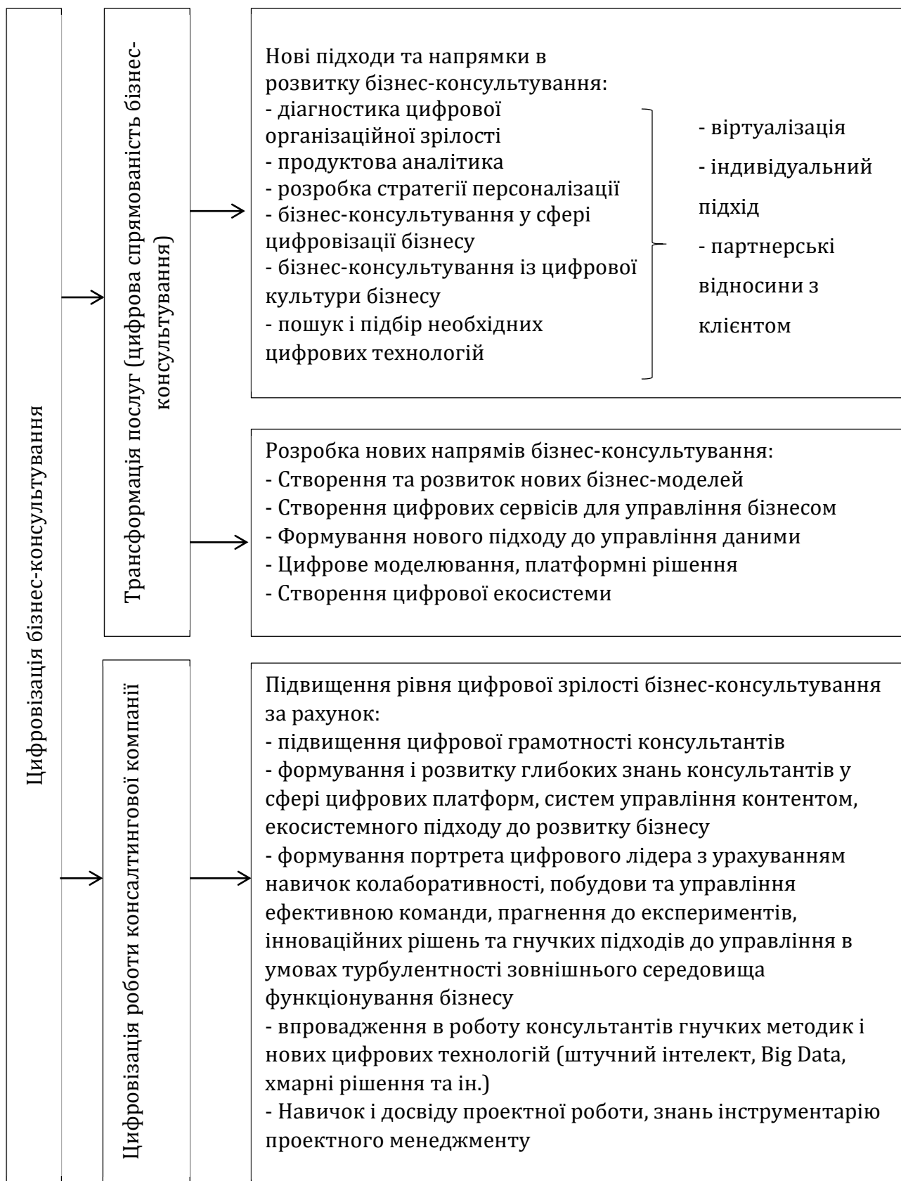
Рис. 1. Модель надання бізнес-консультацій, що відображає цифровізацію сфери консультування