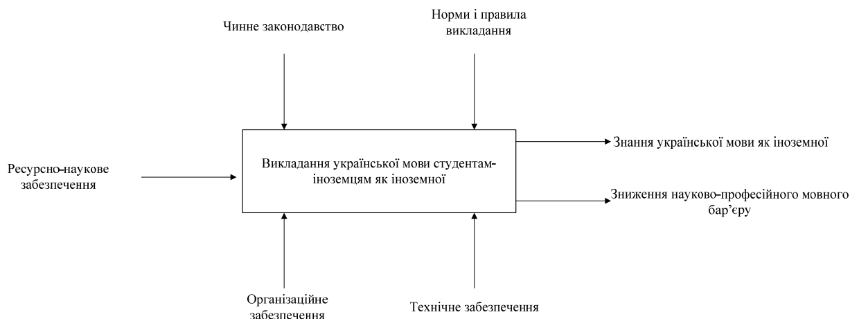
Рис.2. Модель викладання української мови для студентів-іноземців в закладах вищої освіти України

Застосування сучасних інструментів в онлайн-курсі створює передумови для інтенсифікації процесу навчання за рахунок інтерактивності, негайного зворотного зв'язку з учнями, візуалізації великих обсягів інформації, легкого доступу до неї, а також контролю та самоконтролю навчальної роботи студентів-іноземців. За умови обґрунтованого вибору викладачем інформаційно-комунікативних технологій для проведення онлайн-навчання освітній процес зможе стати в повному розумінні інноваційним, дозволяючи більш повно реалізовувати індивідуальний підхід до навчання, а також підвищувати мотивацію студентів-іноземців та забезпечувати більш міцне засвоєння ними навчально-програмного матеріалу.