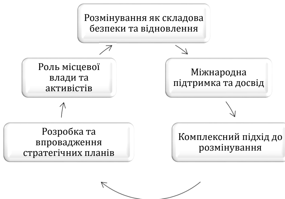
Рис. 1 – Сучасні аспекти гуманітарного розмінування територій в контексті комплексного відновлення області та територіальної громади

гуманітарного розмінування територій в контексті комплексного відновлення області та територіальної громади.